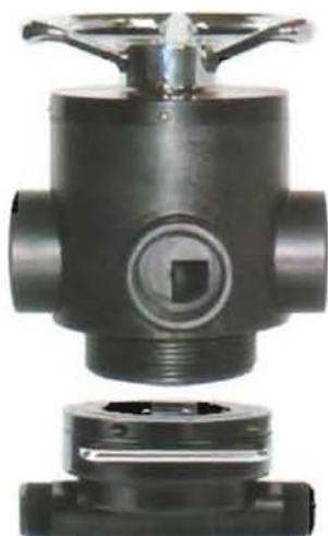
4" 侧装连接件 connector for side-mounted