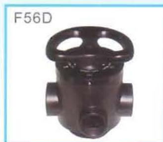
运行状态 Service State

控制器模式 Control Model ----- 手动式 Manual 适用压力 Suited Pressure ----- 0.1~0.6MPa 适用水温 Suited Water Temperature ----- 5~45℃