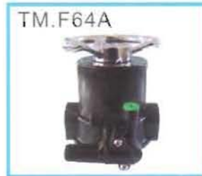
运行状态 Service State

适用水温 Suited Water Temperature ----- 5-45℃